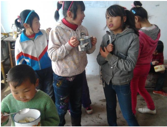
食堂简陋，吃饭就是抱着饭盆随地吃