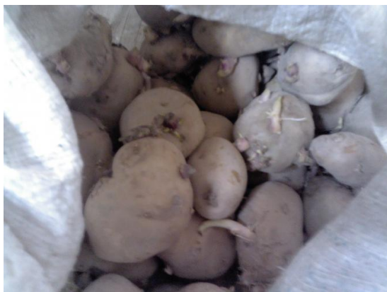
主菜土豆，看的出时间都很久了，都发芽了。