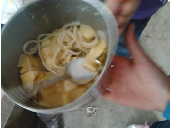
一份典型的午餐：土豆+面食，没肉、没菜